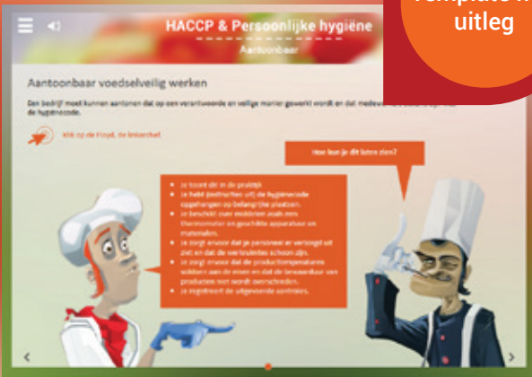
Template met uitleg