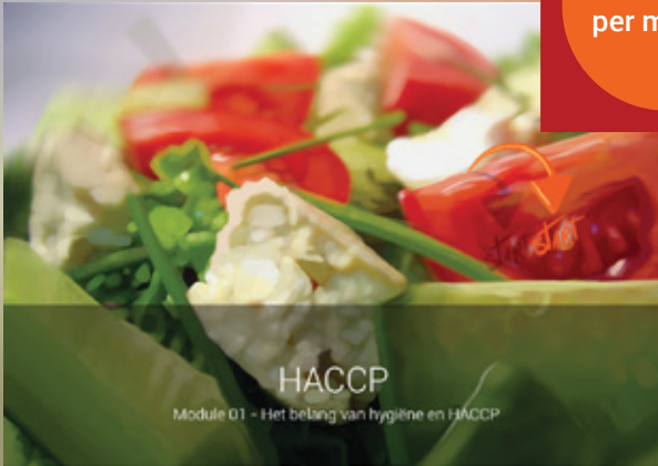
Startscrem per module